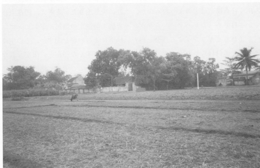
ドンビンエン村の風景

ベトナム革命を通じて1980年までは、国营農場、合作社（共同農場）で人々は共同作業を行っていたけれども、1981年から国营農場、合作社の土地を個別農家に経営委託、政府は労働力人口1人あたり360m 2 の農地を貸し付け 6 （国際農林業協力協会のレポートによると、各農家の労働意欲に応じて若干の上乗せ配分がある 7 ）、「自作農」を創設した、正確には耕作請け負い単位を生産集団から個別農家に移した。ドンビンエン村の場合、全国平均の360m 2