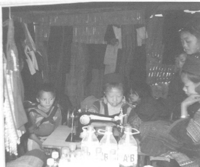
働く子どもたち (サパ)

れたエリアにすぎない。サパという世界的に有名なトレッキングの名所があり、段々畑のある日本的な風景が広がる美しいところだが、ガイドで日本語が話せる者はいない。もし街角でくらす子どもたちの中から、日本語とパソコンを習得し、観光産業に職を見つけた彼らの先輩が1人でも出てくれば、あとに続く子どもたちに大きな夢を与えることになるだろう。