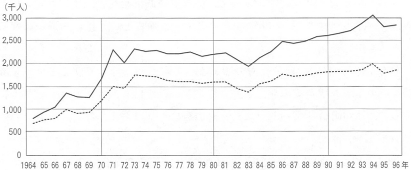
図IV-1 草津町への総入り込み客数と宿泊客数(1964-96年)

駒澤大学文学部地理学科・須山研究室『温泉集落草津の地域性』1999年, 32ページ。