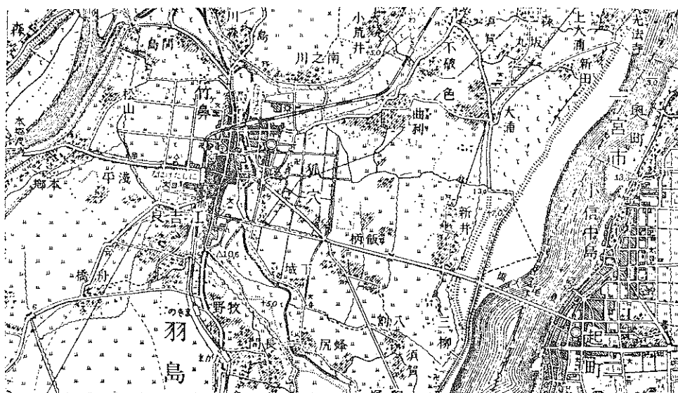
1965年発行5万分の1地形図による。

既に前項において繊維工業の発展状況を比較検討したが、1968（昭和43）年を100とした1978（昭和53）年の伸び率をみると織物業においても繊維工業の全体傾向と同じ傾向を示す。ただ、綿、スフ織物業においては従業者数のみが、72.4%と他の業種に比して減少の割合が小さく、事業所数、製造品出荷額とも伸びており唯一の成長部門と考えられる。毛織物業においては事業所数に比して従業者数の減少が目立ち約半分となっている。製造品出荷額の停滞を考えあわせると生産の内部構造において何らかの変化を認めざるをえないものと推察される。このことは毛織物業の比重の高い羽島市においても同じ傾向を示しているものと考えられる。